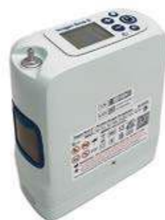
Inogen Rove 6