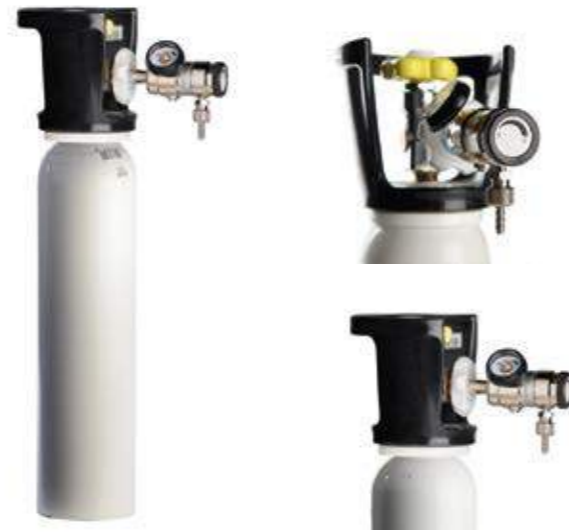
2 liter cilinder