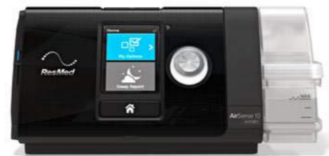
ResMed AirSense 10