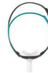
Therapy Mask 3100 NC van Philips