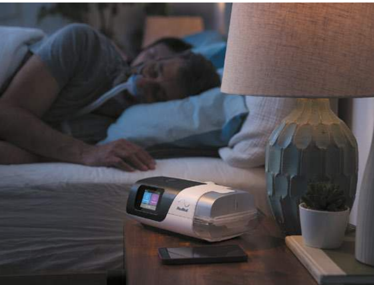
ResMed AirSense 11