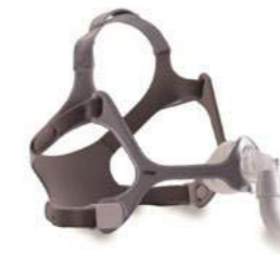
Wisp fabric frame van Philips