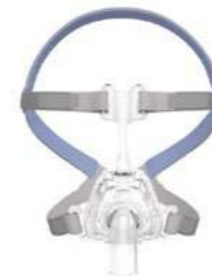
Mirage FX van ResMed