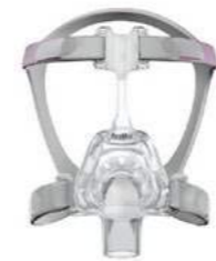
Mirage FX for Her van ResMed