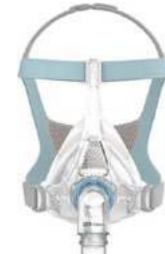
Vitera van Fisher & Paykel