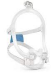
F30i van ResMed