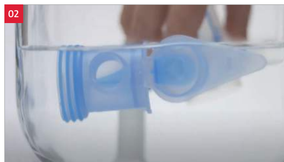
02. Wassen met drie druppels mild afwasmiddel.