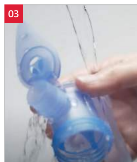
03. Afspoelen onder handwarm kraanwater.