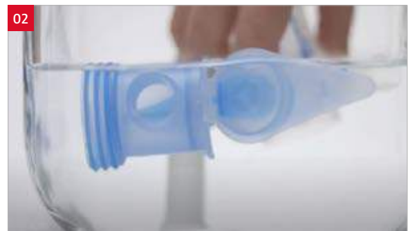
02. Wassen met drie druppels mild afwasmiddel.