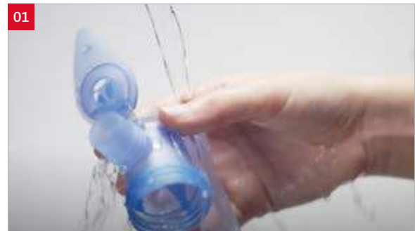
01. Afspoelen onder handwarm kraanwater.

Westfalen Medical komt 1x per jaar langs om de compressor te meten en het filter te vervangen.