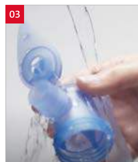
03. Afspoelen onder handwarm kraanwater.