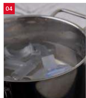
04. Uitkoken, 5 minuten of steriliseren in een sterilisator.