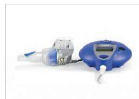
eFlow ® rapid eBase