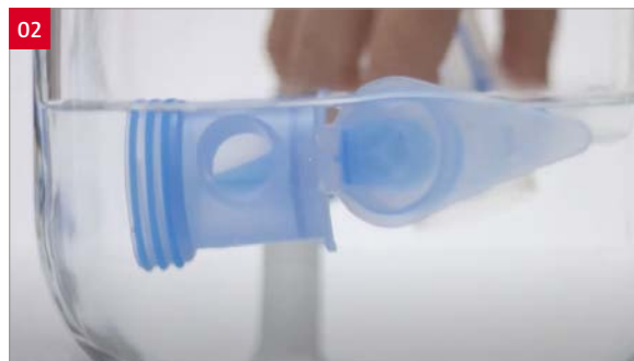
02 2. Wassen met drie druppels mild afwasmiddel.